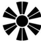
Le Kamon de la famille seigneuriale « Ryuzodera », que l'on retrouve sur la Saya. 龍造寺家の家紋「日足」